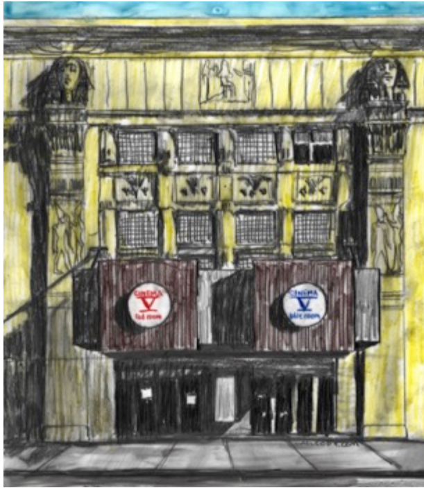
Cinéma V, $30 11"X 8.5"