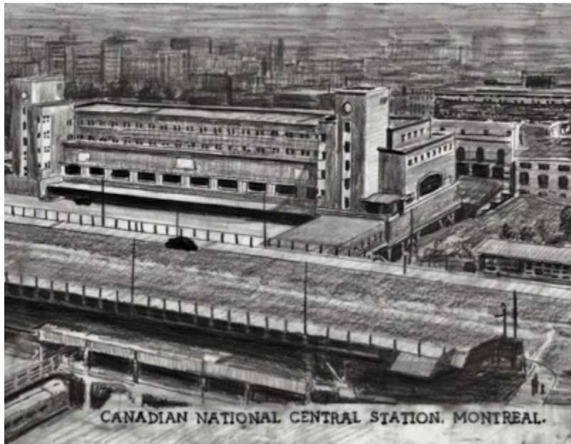
CN station centrale Montréal, $30 11"X 8.5"