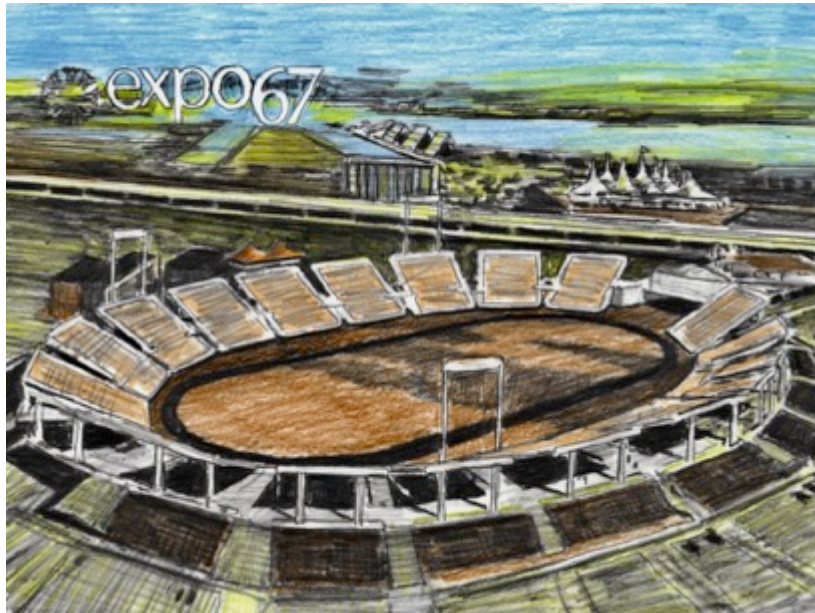
Autostade Expo '67, $30 11"X 8.5"