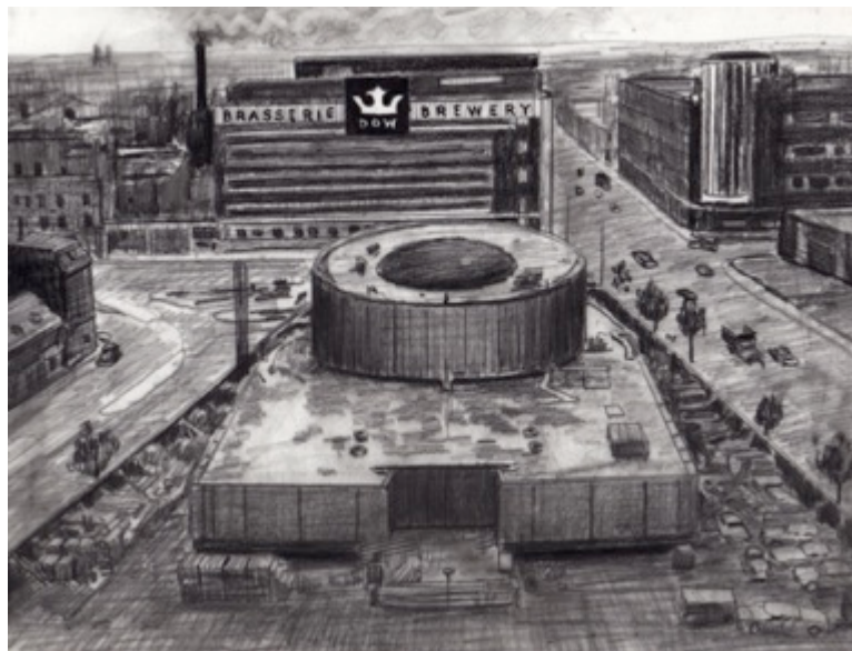
Brasserie Dow et le Planetarium - Griffintown, $30 11"X 8.5"