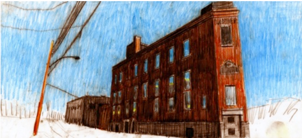
Kander Paper Stock Company Ltd. $30 8.5"X 11"