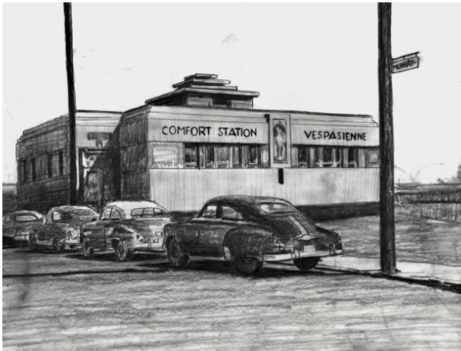
Vespasienne Griffintown, $30 8.5"X 11"