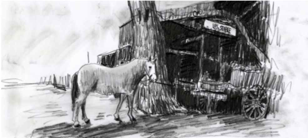
Griffintown Horse Palace, $30 8.5"X 11"