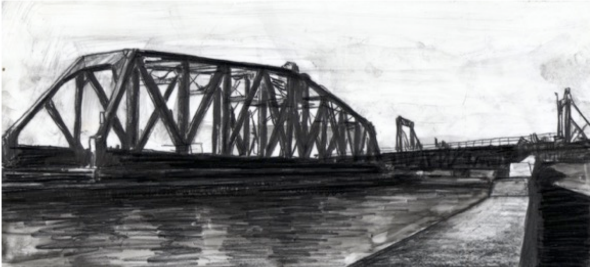
Pont pivotant du Canadien National - Canal Lachine, $30 8.5"X 11"