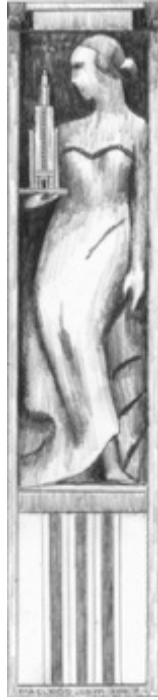
Bas-Relief Maison Cormier, $30 11"X 8.5"