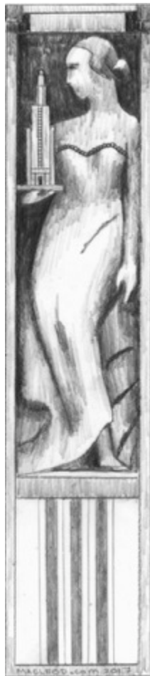
Bas-Relief Maison Cormier

MacLeod 9 Productions G. Scott MacLeod BFA, MA 2319 Av de Hampton #1 Montréal, Qu.bec, H4A 2K5 Canada 514. 487. 8766