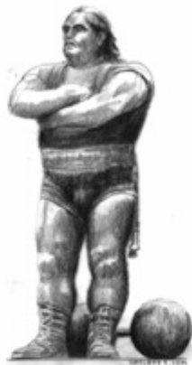
LOUIS CYR 1863-1912