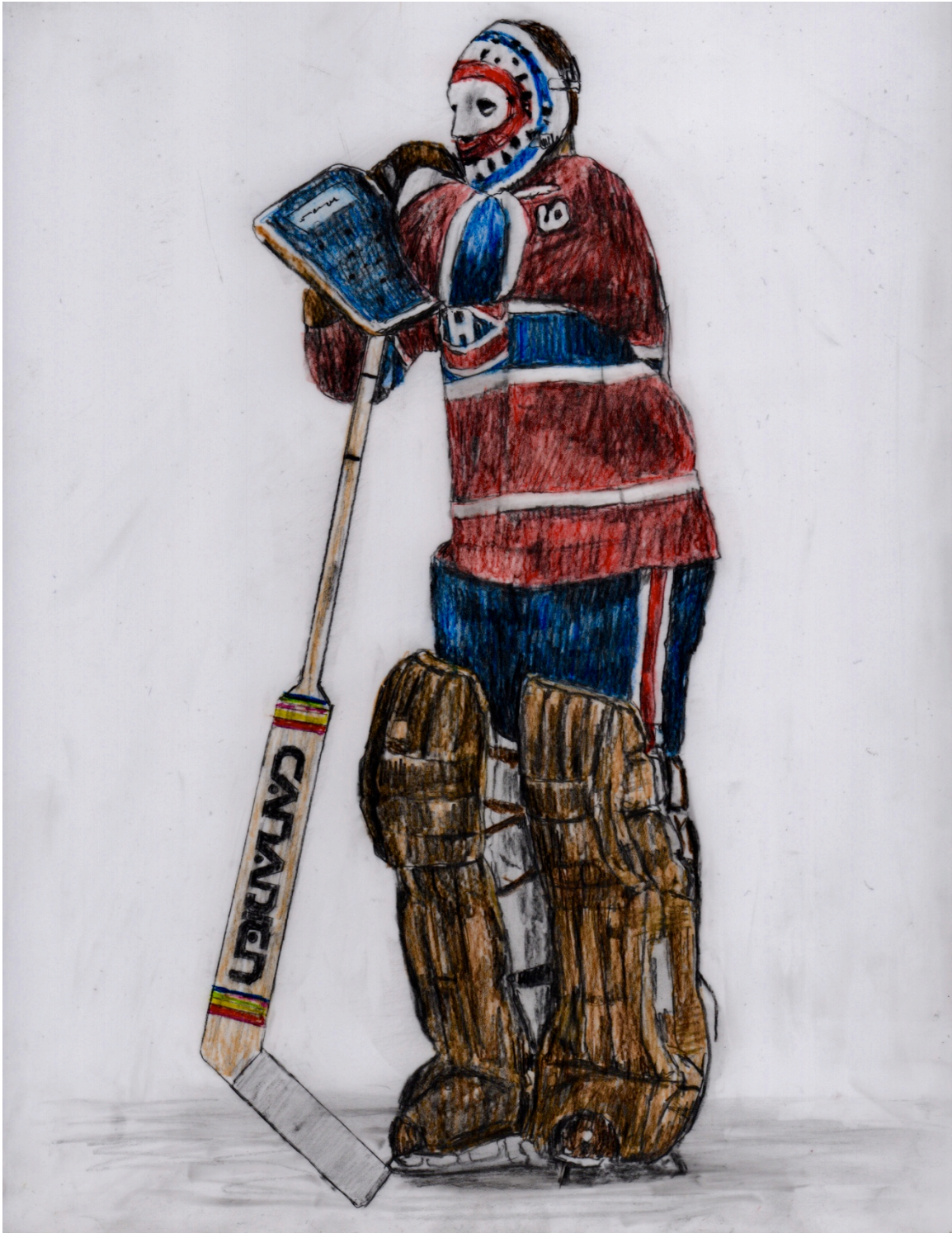
Ken Dryden – 1947 – 2025, $29 11"X 8.5"