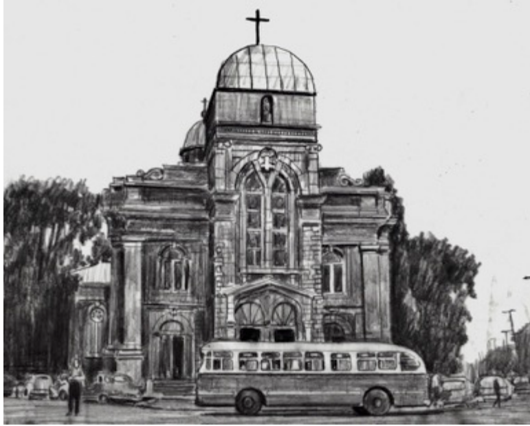
Église St. Ann - Griffintown, $30 11"X 8.5"