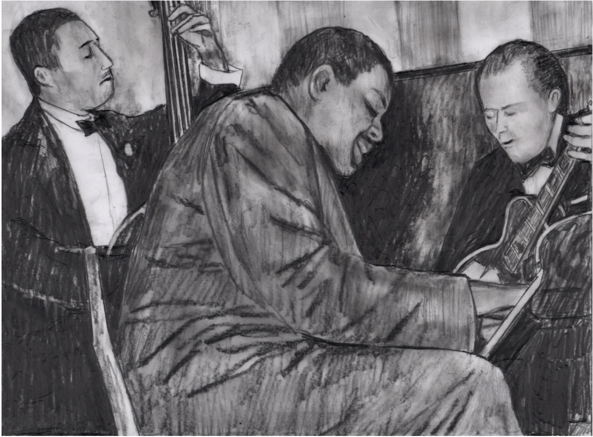
Trio Oscar Peterson, $30 11"X 8.5"