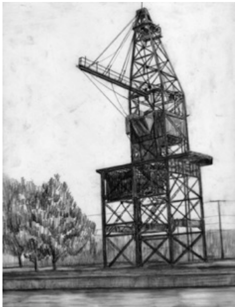
Grue à coke de La Salle – Lachine Canal, $30 11"X 8.5"