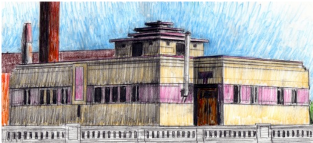
Gallery Square Griffintown, $30 8.5"X 11"