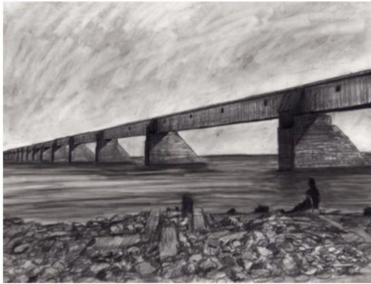
Pont Victoria, $30 11"X 8.5"