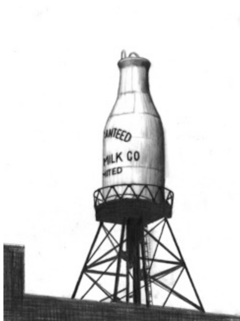
Guaranteed Milk Co. Limited, $30 11"X 8.5"