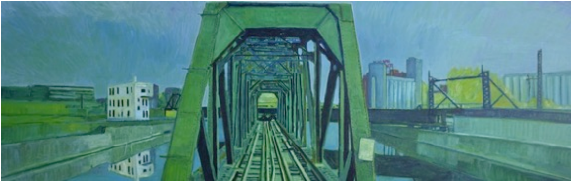
Pont pivotant CN - Canal Lachine, $30 8.5"X 11"