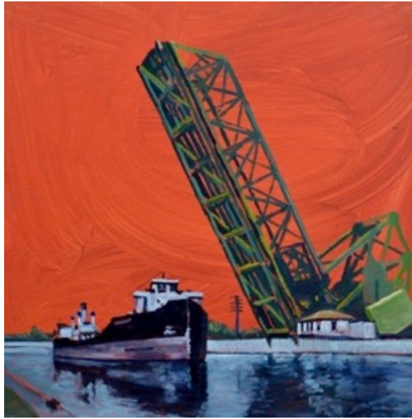
Pont Gauron, $30 11"X 8.5"