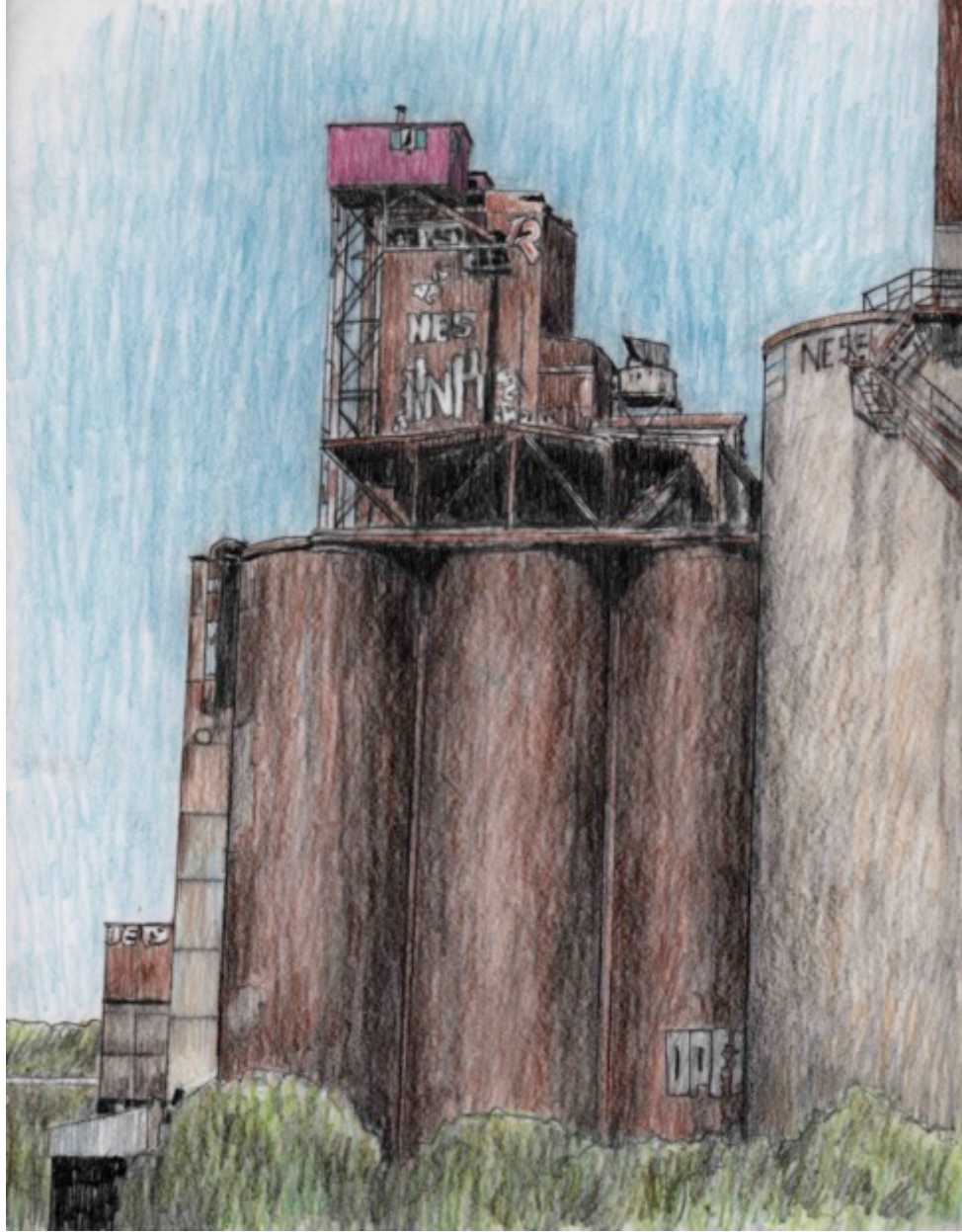
La Maison Rose – Silos de maltage canadiens, $30 11"X 8.5"