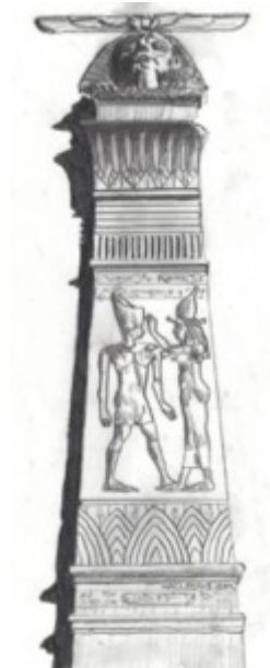
Empress Theatre Detail, $30 11"X 8.5"