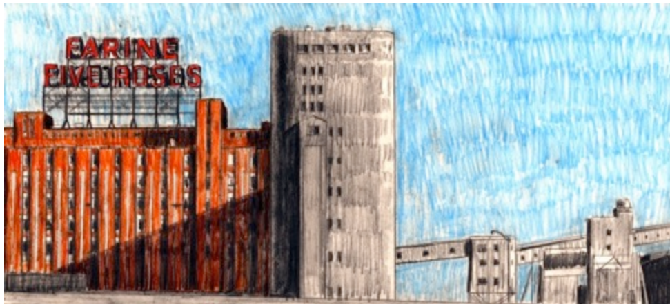
Farine Five Roses, $30 8.5"X 11"