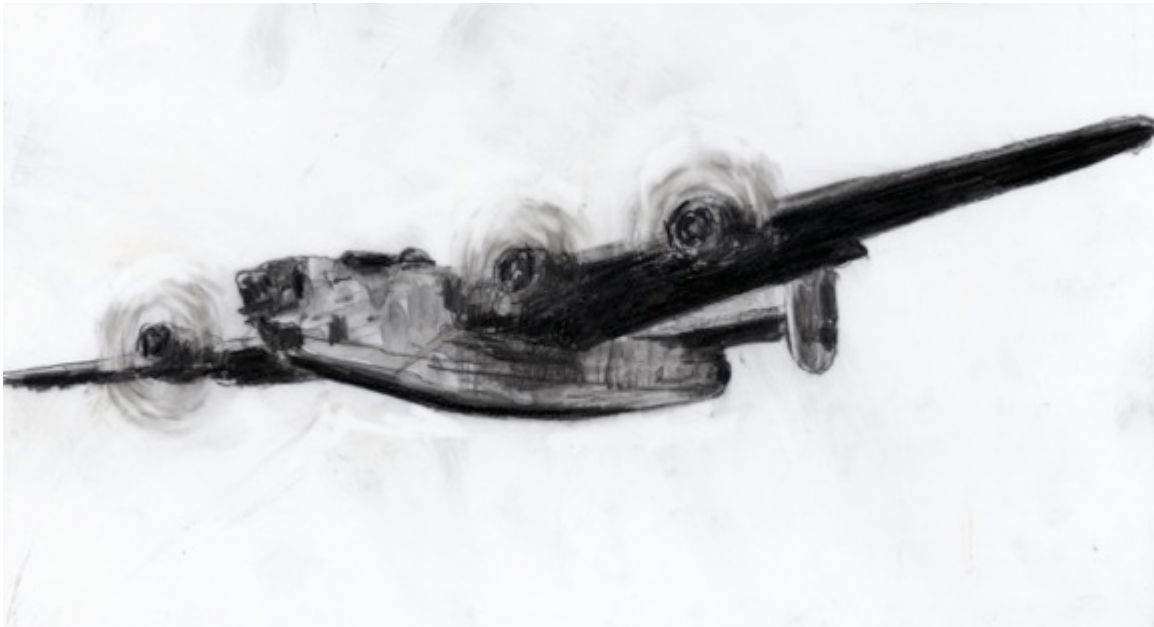
Liberator EW 148 - Griffintown, $30 8.5"X 11"