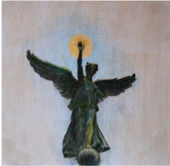
George-Étienne Cartier Monument, $30 11"X 8.5"