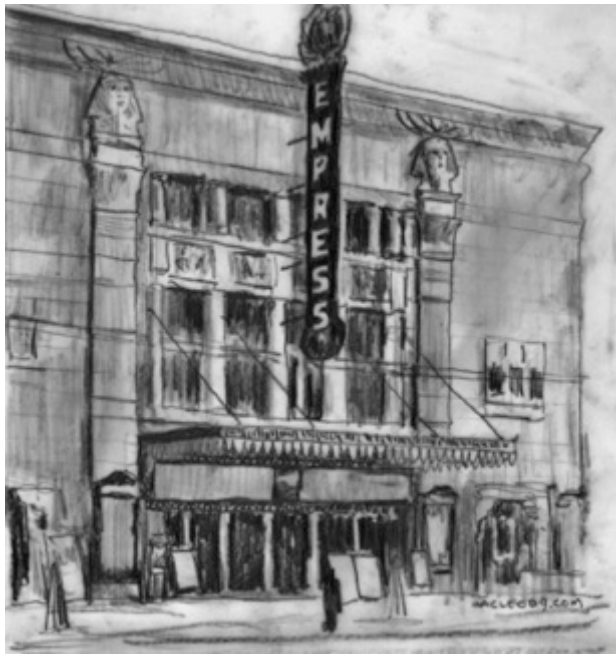
Theatre Empress, $30 11"X 8.5"