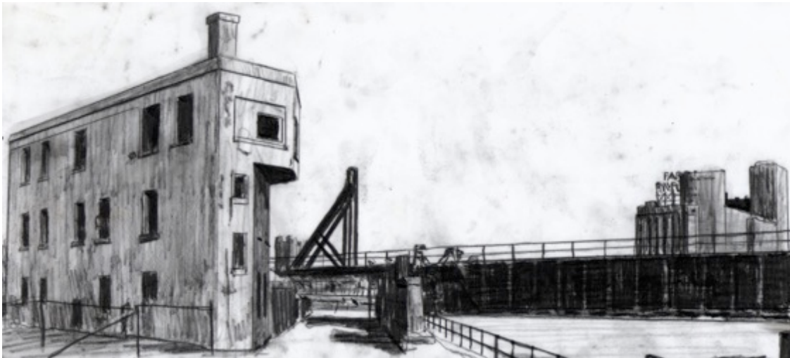
Tour d'aiguillage du CN - Canal Lachine, $30 8.5"X 11"