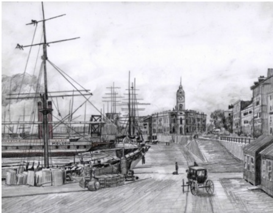
Port de Montréal, $30 8.5"X 11"