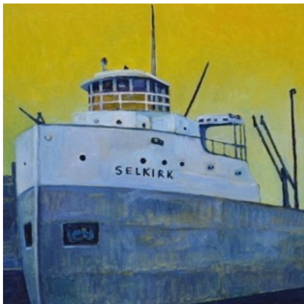
S.S. Selkirk, $30 11"X 8.5"