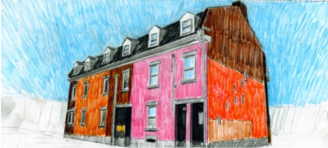
Maison Benedict Labré, $30 8.5"X 11"