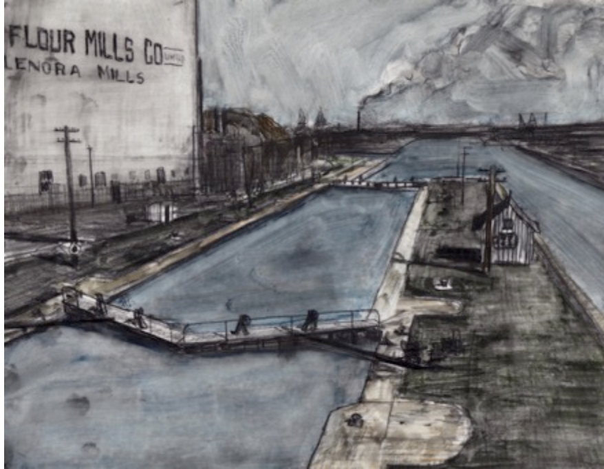
L'écluse Saint Gabriel - Lachine Canal, $30 8.5"X 11"