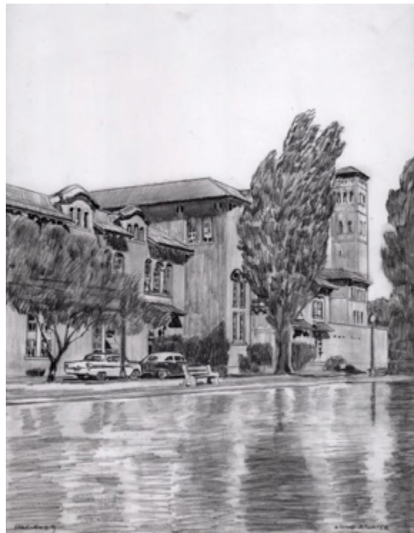
Usine Atwater, $30 11"X 8.5"