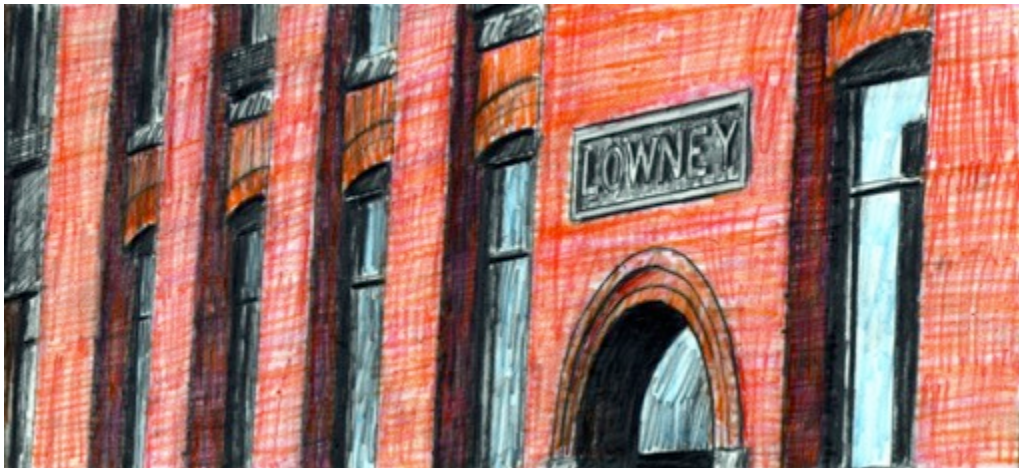
Walter M. Lowney Company of Canada, $30 8.5"X 11"